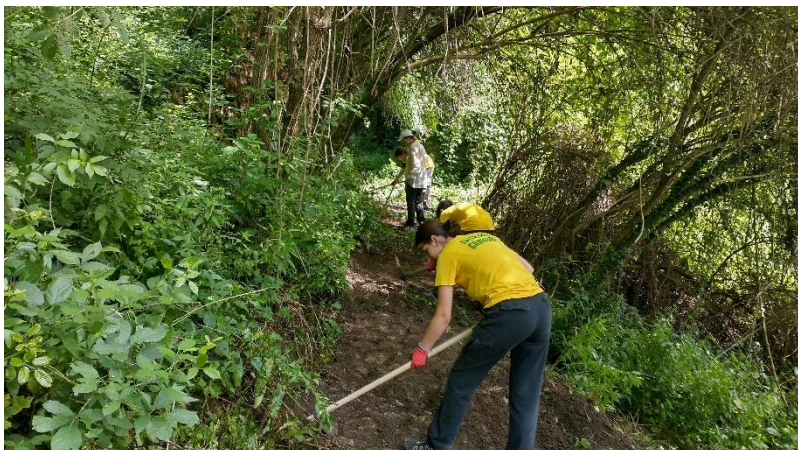
Ragazzi al lavoro sulla messa in luce del tratto sud del sentiero di Celante

L'intervento di recupero ha visto i ragazzi impegnati per 3 mattinate nelle attività di apertura del sentiero chiuso dai rovi in 2 punti, nella messa in luce del tracciato in pietra ove ricoperto dall'erba, nella pulizia della vasca e del lavatoio e in piccoli interventi di ricostruzione del selciato, dei muretti e ripristino dei percorsi e delle canalizzazioni di scolo dell'acqua. Per certi versi il lavoro sembrava un'attività archeologica dove ad ogni zappata venivano allo scoperto manufatti e particolari costruttivi sconosciuti.